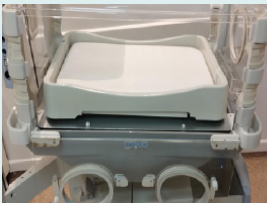
Figura 1. Bandeja porta-colchón y colchón de una incubadora