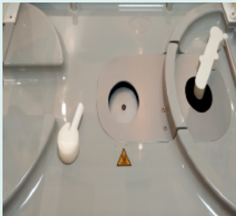
Figura 7. Base de la incubadora

Las incubadoras con humedad activa disponen de un sistema agregado de servo humedad que además de las recomendaciones generales requiere de algunos pasos específicos para una correcta limpieza y esterilización.