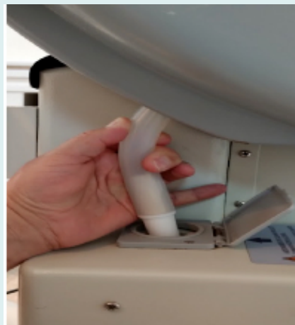
Figura 6. Conector de alimentación de humedad, que dirige la humedad del reservorio al habitáculo donde se encuentra el recién nacido