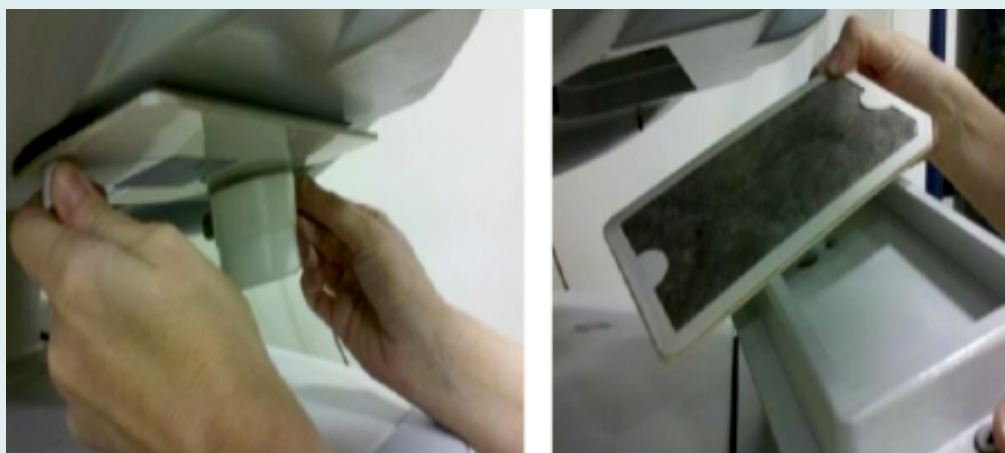
Figura 11. Cambio del filtro de una incubadora