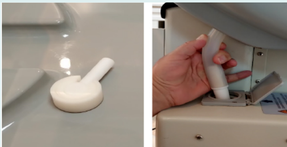
Figura 10. Conexión superior e inferior