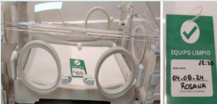
Figura 12. Chequeo-registro-recambio

Se deben realizar controles y recambio de los filtros de aire cada 3 meses o en caso de que esté visiblemente sucio (Figura 12).