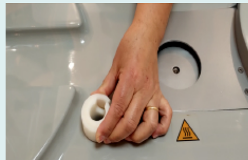
Figura 9. Cierre del conector