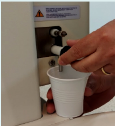
Figura 5. Llave de desagote interno