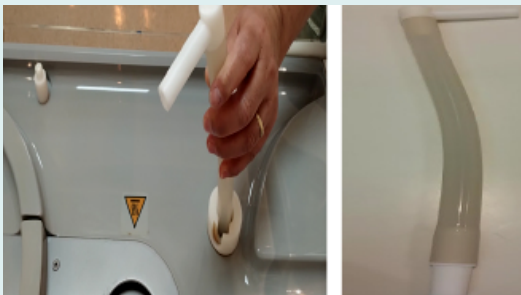
Figura 8. Desconexión del conector