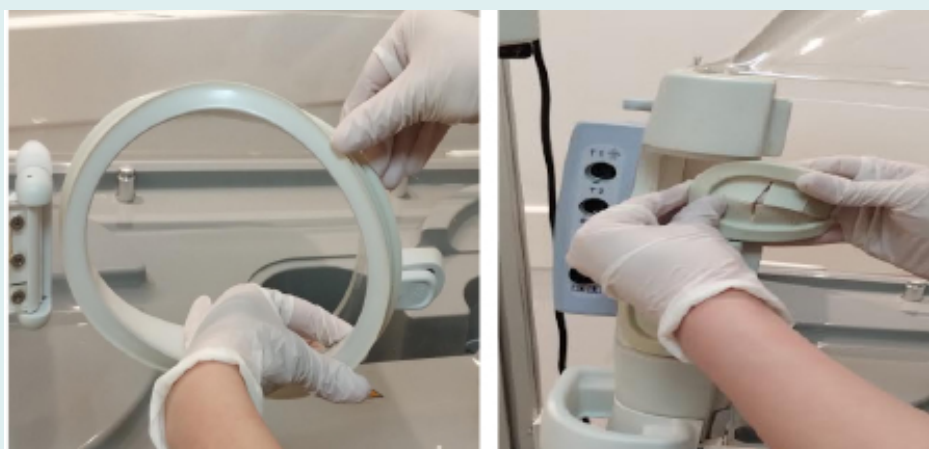
Figura 2. Mangas, portillos, gomas de los portillos y pasacables